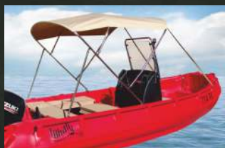
TENDOLINA / TENDA