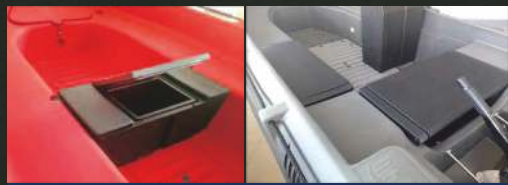
SJEDALO SA SPREMIŠTEM