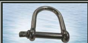
PRIVEZNI "D" PRSTEN WHALLY