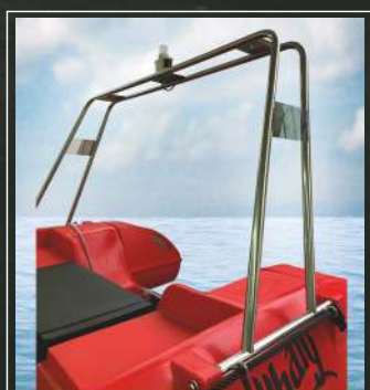
TIPSKI ROLL BAR