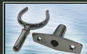
POSTOLJE ZA VESLA (RAŠLJA SA DRŽAČEM)