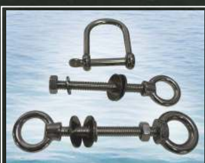
INOX PRIVEZNI SET