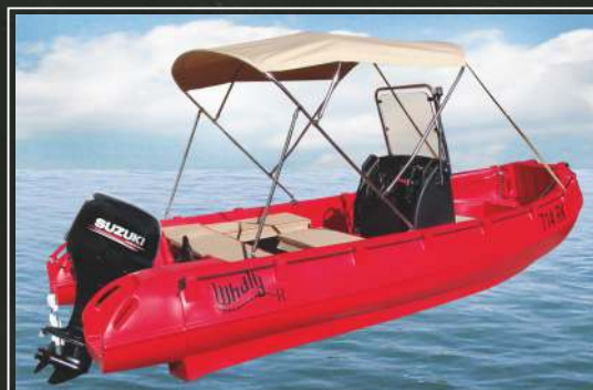
TIPSKA INOX TENDOLINA