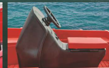
UPRAVLJAČKA KONZOLA "JOCKEYSEAT WHALY"