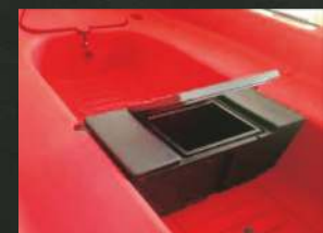
SJEDALO SA SPREMIŠTEM