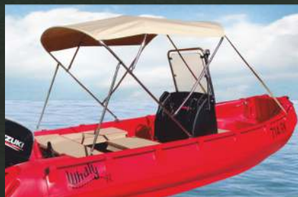
TENDOLINA / TENDA